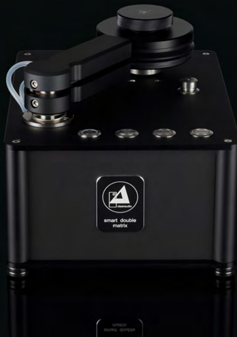
smart double matrix

Mit der smart double matrix konzentriert sich clearaudio auf das Wesentliche und macht damit professionelle Schallplattenpflege unkomplizierter und zugänglicher.