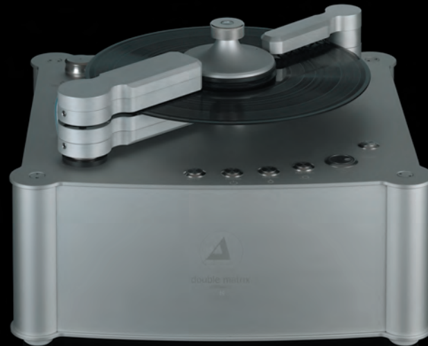
double matrix professional SONIC, silver

Besonders effizient wirkt sich die von clearaudio entwickelte „Sonic Option“ aus. Sie reinigt das Vinyl besonders schonend und tiefenintensiv durch Vibration. Dennoch „wäscht“ und konserviert die neue double matrix professional SONIC audiophile Kostbarkeiten nahezu geräuschfrei. Und obwohl sie klar als Profi-Gerät klassifiziert wird, lässt sie sich spielend leicht bedienen und warten. So erfolgt der Austausch der Mikrosamtstreifen in nur wenigen einfachen Schritten. Die Füllstandsanzeige informiert jederzeit über die verbleibende Reinigungsflüssigkeit.