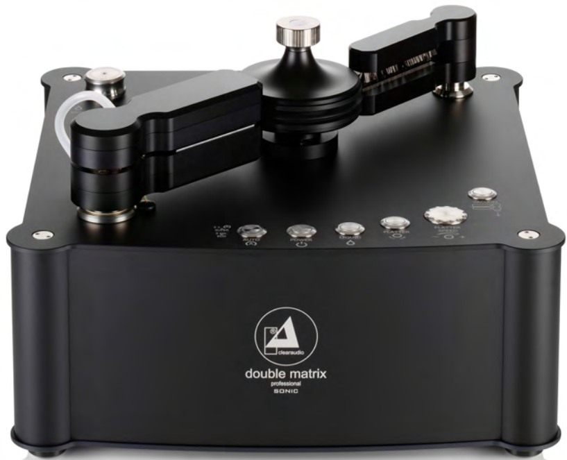
double matrix professional SONIC, black

Einheit zur doppelseitigen Reinigung, geöffnet.